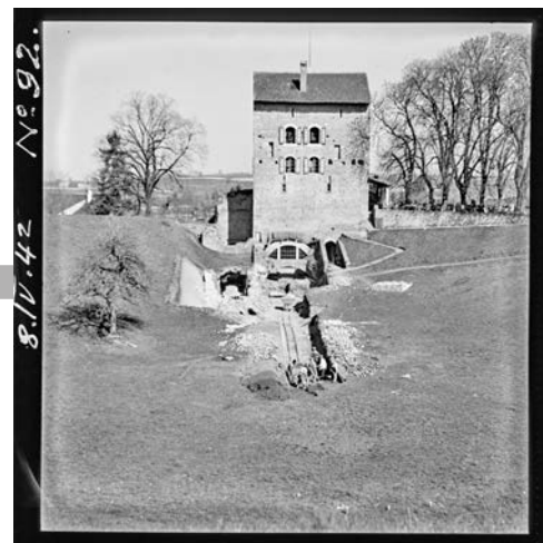
L'amphithéâtre d'Avenches en avril 1942. Une tranchée de repérage est effectuée au centre de l'arène, alors encore recouverte de terre et de végétation.