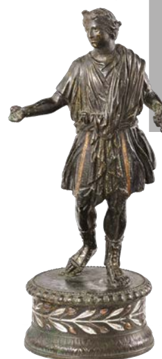
Statuette d'un dieu Lare découverte en 1916 dans un quartier d'Aventicum.