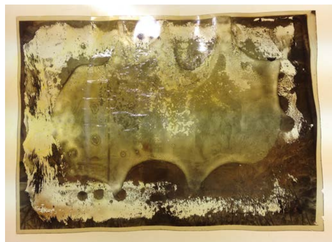
Un négatif de 1924 sévèrement dégradé. À ce stade, le document est perdu.

À la fin du mois de mai 2018 en effet, au hasard de la consultation des archives, on découvre des négatifs très abîmés : les images, illisibles, semblent avoir littéralement fondu et dégagent une odeur piquante !