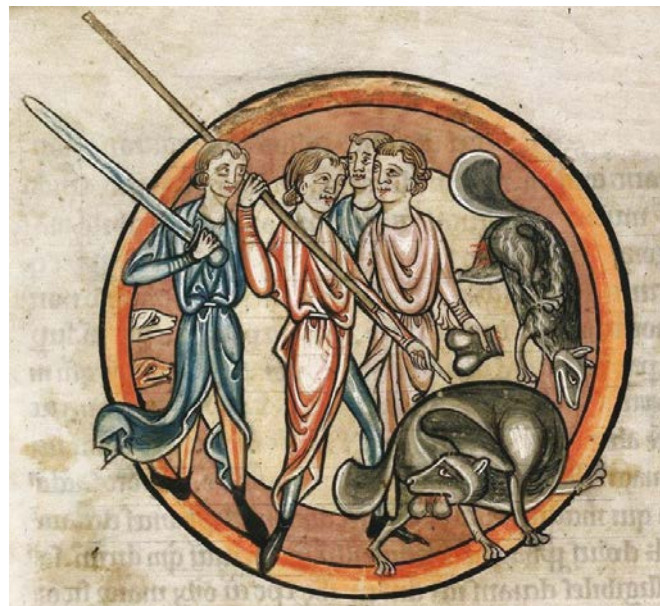
Mythe de l'autocastration du castor. Bestiaire de Salisbury, 13 e s. British Library

parfumerie. La confusion des glandes à castoréum avec les testicules est à l'origine du mythe de l'autocastration des castors qui, se sachant poursuivis pour ces glandes, se mutileraient pour échapper aux chasseurs. Pour certains auteurs médiévaux, cette allégorie de la moralité et du sens du sacrifice, inspirée d'une fable d'Ésope (6 e s. av. J.-C.), expliquerait l'origine du nom « castor » qui supplante peu à peu « bièvre »