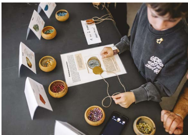
Choix d'une gemme lors de l'atelier Secrète amulette . ArchéoLab

C'est cette amulette caractéristique du monde romain que l'ArchéoLab a présentée durant les Journées vauvoises d'archéologie. Les visiteurs, les familles en particulier, avaient la possibilité de produire leur propre bulla à l'aide de matériaux choisis (cuir simple ou doré, fils d'or ou laine rouge). Afin de favoriser une véritable appropriation, le public était ensuite invité à réfléchir