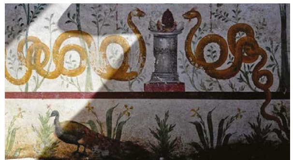
Reconstitution d'un laraire par l'équipe des SMRA en 2023 et trois laraires de Pompéi qui ont servi de modèles (Maison des Amours dorés, à gauche, Maison des Vettii, ci-contre, et Maison du laraire, ci-dessus). Alexandra Spühler; Parco Archeologico di Pompei

officie devant un autel, évoquant un sacrifice. Sous cette scène, deux serpents sont représentés, affrontés et dressés, de part et d'autre d'un autel sur lequel se trouvent des offrandes (pomme de pin, œufs). Les serpents, gardiens de la maison, se dirigent vers l'autel pour recevoir les offrandes qui ont été sacrifiées par le paterfamilias sur la scène peinte au-dessus. Tous ces éléments iconographiques constituent une scène générique figurant un sacrifice qui engage à accomplir le rite. C'est le père de famille qui préside le culte auquel toute la famille participe, esclaves compris, pour rendre hommage aux dieux protecteurs.