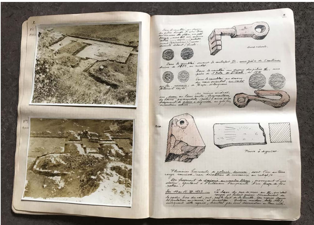
Le journal des fouilles du théâtre des années 1927-1948, illustré de photos, de frottis et de dessins (pages datées de novembre et décembre 1927).

La suite du projet prévoit la publication en ligne des images sur Memobase, la base de données multimédia