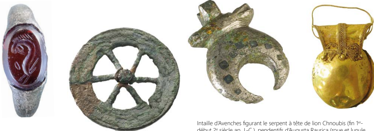
Intaille d'Avenches figurant le serpent à tête de lion Chnoubis (fin 1 er -début 2 e siècle ap. J.-C.), pendentifs d'Augusta Raurica (roue et lunule, 1 er -2 e siècle ap. J.-C.), bulla d'Étrurie (4 e -3 e siècle av. J.-C.).

Les rites et objets destinés à la protection occupent une place prépondérante durant l'Antiquité romaine. Leurs traces nombreuses témoignent de l'importance des systèmes de croyances magico-religieuses, aux côtés des considérations naturalistes expliquant certains phénomènes physiques, notamment dans le domaine médical. On porte alors des amulettes faites de substances animales, végétales ou minérales (os, bois de cerf, gemmes, etc.) pour leurs propriétés médicales, tandis que les bijoux de métaux divers sont avant tout destinés à se prémunir du mauvais œil.