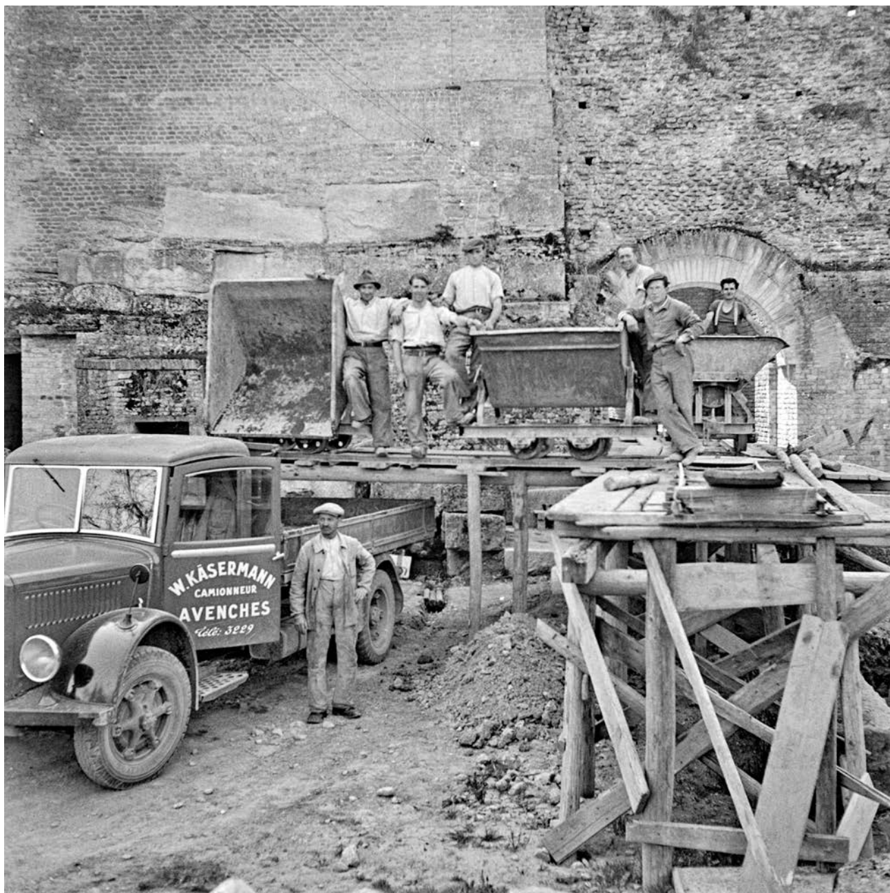
Un groupe d'ouvriers occupés sur le chantier de l'amphithéâtre, posant sur la place du Rafour à l'entrée Est du monument. Photo de Louis Bosset, 1942.

publique de Memoriav. C'est l'occasion de dresser un inventaire complet des négatifs, dont le seul outil de recherche est une liste sommaire (et parfois erronée) rédigée en 2008. Tout au long de l'année 2023, les trois personnes composant l'équipe des archives des SMRA s'attellent donc à ce travail minutieux, qui exige de nombreuses recherches dans la documentation originale, notamment les journaux de fouille. C'est une chance de « revenir aux sources », en replongeant dans ces documents historiques, parfois émouvants, souvent rédigés et illustrés avec soin.