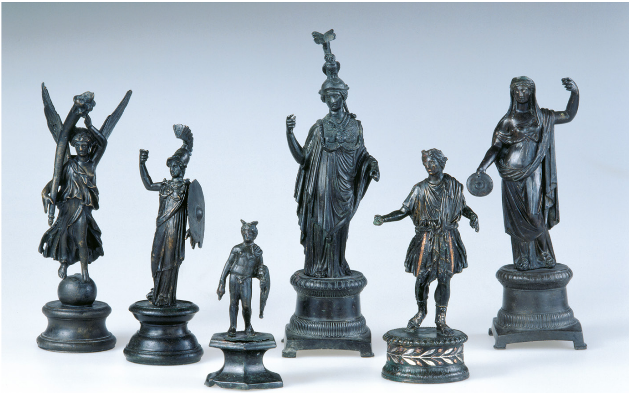
Victoire, Minerve, Mercure, Minerve, Lare et Junon : six statuettes en bronze découvertes à Avenches en 1916.